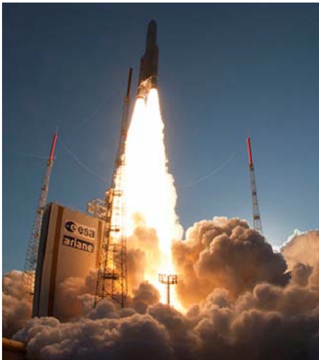
Décollage de la fusée Ariane 5

Les progrès réalisés au cours de ces vingt dernières années dans la résolution des équations de l'aérothermochimie et du transfert radiatif permettent aujourd'hui de disposer de modèles physiques pour prédire l'émission infrarouge des jets de moteurs-fusées.